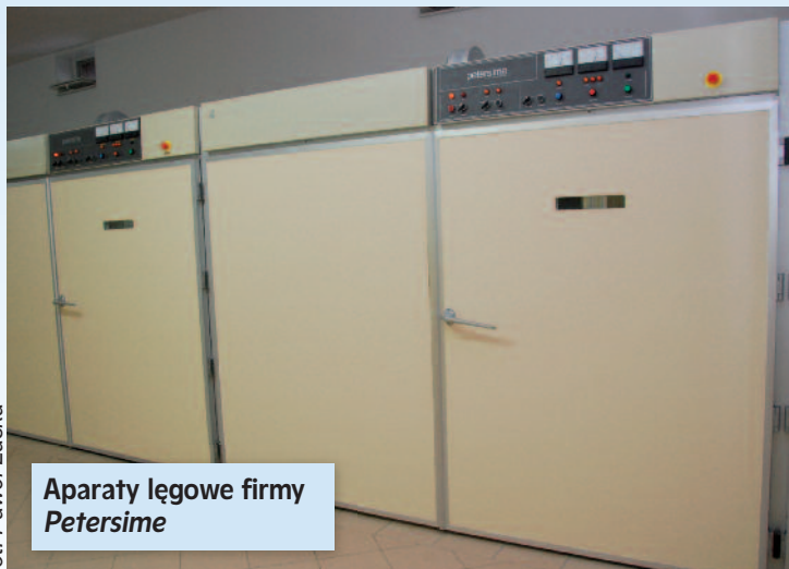
Aparaty lęgowe firmy Petersime

konuje zakupu pierwszych aparatów firmy Petersime do inkubacji indyków. Nieco później poddaje cały zakład modernizacji, by sprostać wszystkim wymogom unijnym. Tak więc zakład od roku 2003 specjalizuje się tylko w wylęgu piskląt indyckich.