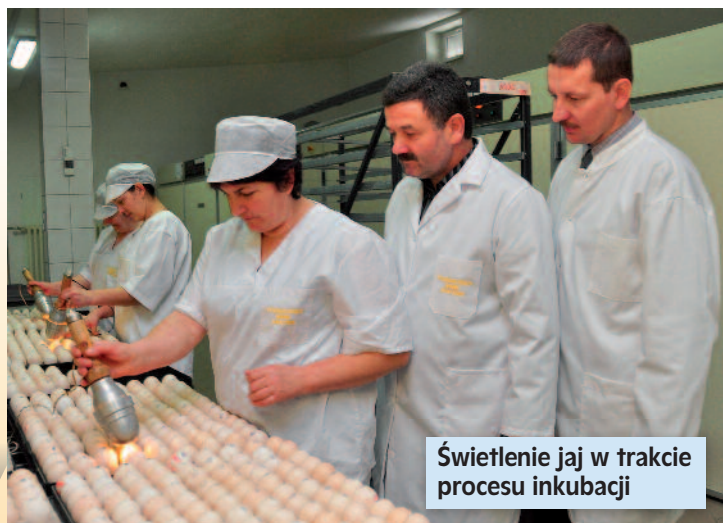
Świecenie jaj w trakcie procesu inkubacji